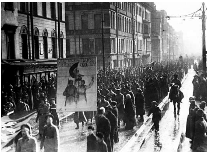
Revolučná demonštrácia v Petrohrade, február 1917. Na transparente je napísané: „Sloboda, rovnosť, bratstvo“.

vytvorila dočasnú inštitúciu s neperspektívnym názvom „Dočasná vláda“, ktorá sa zaviazala zvolať v budúcnosti Ústavodarné zhromaždenie, aby sa rozhodlo o spôsobe riadenia Ruska. Spojenci, ktorí sa zúfalo snažili udržať Rusko vo vojne, okamžite uznali novú vládu. To bola jedna z mála vecí, ktoré hrali v jej prospech.