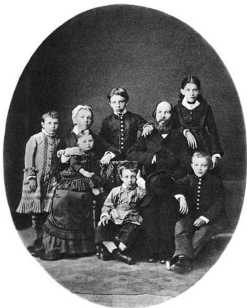
Na tomto štúdiom portréte rodiny Uljanovcov z roku 1879 je vpravo v popredí školák Vladimír; jeho starší brat Alexander (popravený ako terorista vo veku 21 rokov) stojí vľavo.

V jeho marxistickej revolučnej skupine boli etnickí Rusi, ako Lenin a jeho manželka Nadežda Krupská, menej početní ako Židia, Poliaci, Lotyši a ďalší príslušníci národnostných menšín v rámci Ruskej ríše, ktorí boli od konca 19. storočia čoraz viac prenasledovaní cárskymi ruskými úradmi a podliehali politike rusifikácie. Lenin sa v revolučných kruhoch vyznačoval neústupnosťou a potrebou ovládnuť svoju vlastnú malú frakciu, ktorá sa po rozkole v sociálnodemokratickom hnutí v roku 1903 stala známou ako boľševici. Výraz „boľševik“ bol odvodený z ruského výrazu pre „väčšinu“, zatiaľ čo ich odporcovia boli označení ako „menševici“, čo pochádza z ruského výrazu pre „menšinu“ – to bol od Lenina šikovný ťah, keďže v skutočnosti boli menševici väčšinou.