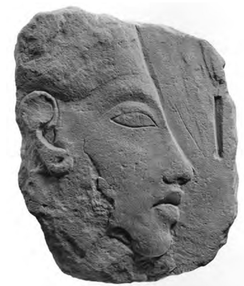
Skúšobný kus Achnatona, vápenec, naznačujúci predĺžené hlavy a tváre s predĺženými črtami typickými pre achnatonské obdobie. (Metropolitné múzeum umenia, New York)

a sochy symbolicky. Napríklad predĺžené hlavy a pretiahnuté tváre Nefertiti a Achnatona mohli byť vnímané ako zodpovedajúce tvaru korún, akoby títo ľudia boli predurčení na to, aby ich nosili. Alebo boli zobrazovaní ako tí, ktorí získali svoje tvary podobné korunám, pretože kráľovská hodnosť sa im stala druhou prirodzenosťou, vďaka čomu vyzerali odlišne od ostatných. (Ani farba pleti sa nezobrazovala naturalisticky. Egypťskí umelci používali rôzne odtiene od svetlohnedej až po takmer čiernu, ale tieto odtiene len málo vypovedali o rase zobrazovanej osoby, čiastočne preto, že starí Egypťania neviazali národnosť na pojem biologickej rasy. Ľudia boli Egypťania, ak hovorili po egypťsky a žili ako Egypťania. 18 )