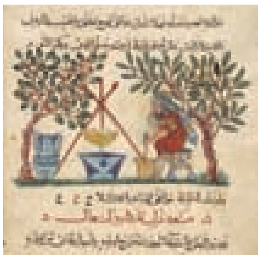
Dioscoridova kniha De Materia Medica z 1. storočia obsahuje viacero receptov na prípravu liečiv z medu. Na obrázku je strana s takýmto receptom v arabskom preklade zo začiatku 13. storočia.

V starovekom Egypte spotrebúvali kňazi veľké množstvá medu pri svojich ceremóniách, na konzerváciu tiel a na kŕmenie posvätných zvierat. Stará egyptská legenda hovorí, že včely sú oživené slzy boha slnka Ra, ktoré spájajú božstvo s kráľovským domom. O dôležitosti včely svedčí aj fakt, že jej hieroglyf bol symbolom kráľovského domu v Dolnom Egypte. Med sa tiež používal na balzamovanie mŕtvych.