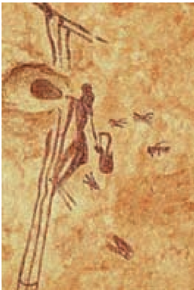
Malba z jaskyne La Araña v Španielsku, stará viac než 8000 rokov, zobrazuje zberača medu, šplhajúceho sa po líanách k hniezdu divých včiel.

Čo sa týka Nového sveta, treba pripomenúť, že včelu medonosnú priniesli do Ameriky až Európania. Indiáni získavali med od viacerých druhov bezžihadlových včiel. Najzručnejšími včelármi boli Mayovia, ktorí mali vlastných včelích bohov, nazývaných Noyumcab a Ah-Mucen Cab. Na ich počesť usporadúvali oslavné ceremónie. Prvý sviatok bol v októbri, mal zabezpečiť vysoké výnosy medu a vrcholil bezuzdným pitím medoviny. Druhý sviatok pripadal na december a jeho účelom bolo udobriť si bohov a zabezpečiť zakvitnutie lúk – a tým dostatok pastvy pre včely.