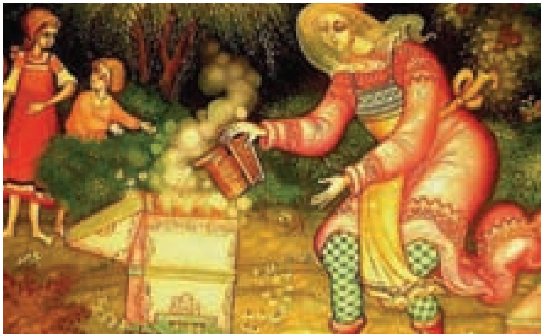
Včelárka upokojujúca včely dymom. Malba na tradičnej ruskej drevenej lakovanej škatulke.

V rámci experimentu na vesmírnej lodi v roku 1984 vystavali včely plást v beztlakovom stave.