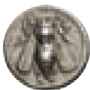
Minca z Efezu zobrazujúca včelu, jeden zo symbolov efezskej Artemis, z 3. stor. pred n.l.

Včely a človeka spája história dlhá milióny rokov. Podobne ako človek, aj prapôvodné včely pochádzali z Afriky, odkiaľ sa rozšírili na iné kontinenty. Med je jednou z najstarších zložiek ľudskej potravy – naši prapredkovia si pochutnávali na mede, vybranom z hniezd divých včiel dávno predtým, ako sa naučili zasiať prvé obilné zrno.